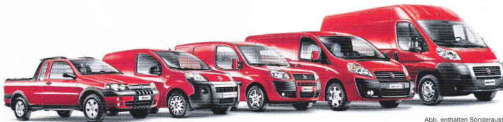
Abb. enthalten Sonderausstattung.